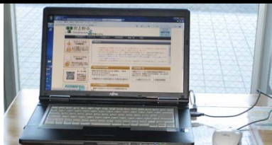
スポーツ施設のインターネット予約