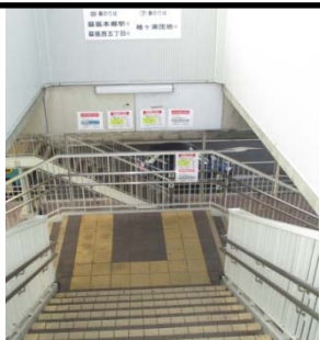
JR 津田沼駅バス停階段に照明灯設置