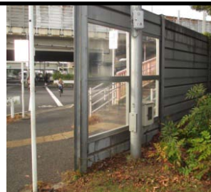
防音壁の透明化への改修。視認性の確保（歩行者安全）