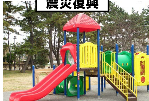
震災で被害にあった公園に新設遊具の整備