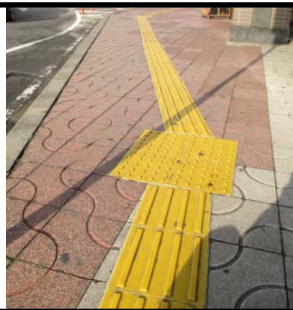
駅前に視覚障がい者誘導ブロックの整備